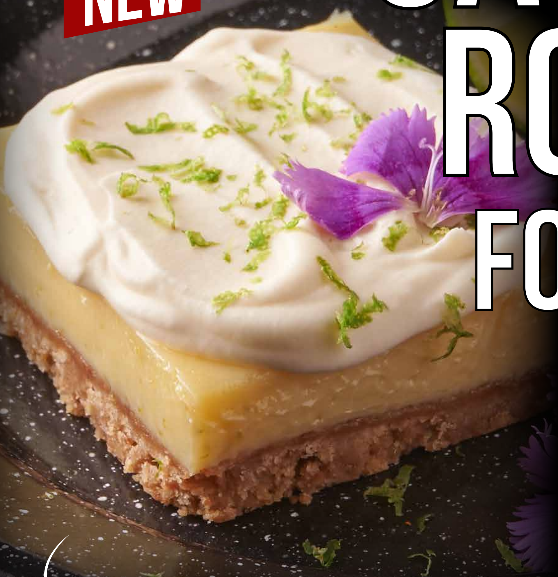
key lime pie